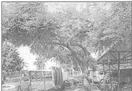
Fotografía 4-4 Parqueadero público, Aeropuerto Ernesto Cortissoz

Ahora bien, una vez corroborado el shape del área de intervención por las obras de modernización, remodelación y ampliación del Aeropuerto Internacional Ernesto Cortissoz, con