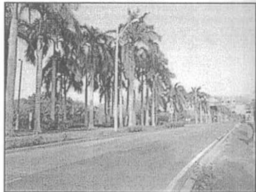
Fotografía 4-2 Berma de la vía de ingreso al Aeropuerto Ernesto Cortissoz

Aeropuerto: Comprende la infraestructura donde funciona una terminal aérea. Incluye las pistas de aterrizaje y carreteo, los edificios, las superficies libres, las zonas de amortiguación y la Vegetación asociada (IDEAM, 2010), como parte de la unidad de aprovechamiento forestal se encuentran los arboles encontrados en el parqueadero público del aeropuerto, como se observa en las fotografías 4 - 3 y 4 - 4.